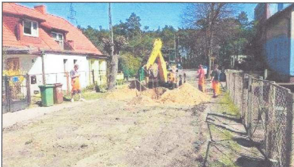
Fot. Budowa ulicy Pszczelnej w Toruniu (na bydgoskim Miedzyniu ul. Pszczelna jest nadal nieutwardzona)

Nazwa sąsiedniego miasta często wywołuje sporo emocji. Warto jednak zauważyć i docenić starania Włodarzy tego grodu, którzy konsekwentnie budują ulice, przeznaczając konkretne środki finansowe. W roku 2015 jest to kwota 14,7 mln złotych.