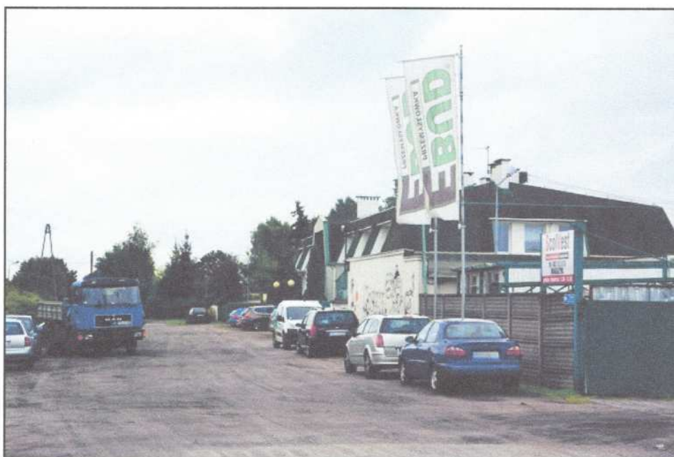
Fot. Ulica Biskupińska na Prądach, jedna z firm mająca swoją siedzibę przy ulicy gruntowej