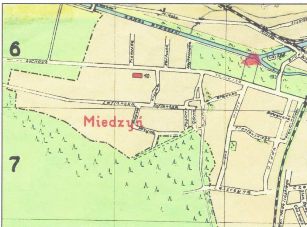
Fot. Fragment planu Bydgoszczy z 1939 roku z ulicami Miedzynia